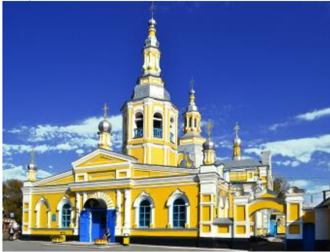
Спасо-Преображенского собора в г. Минусинск

(Злой, грубый, отнять, поругать, ленивый, обидеть, огорчить, грустный, крикливый, трусливый).