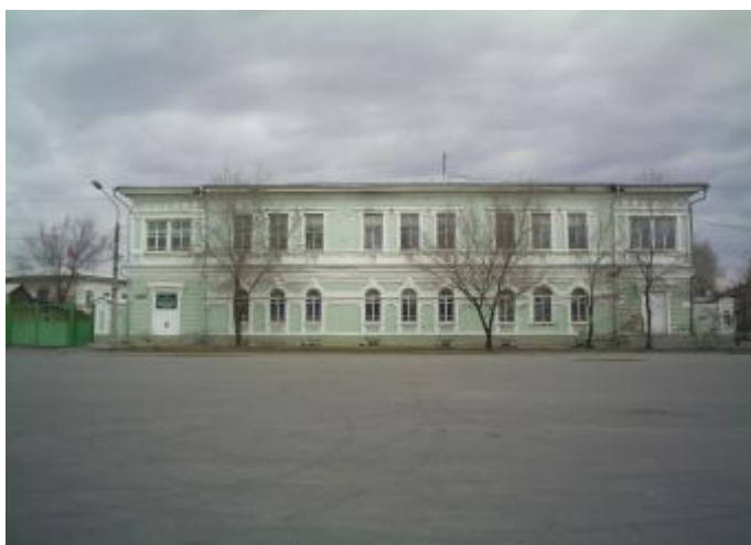
Усадьба купца Борисова в Минусинске.