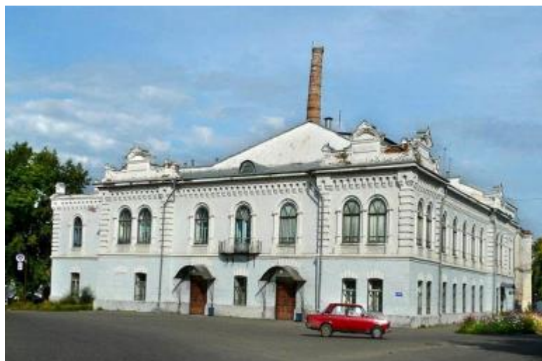
Минусинский драматический театр